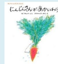
＜作：文：松谷まよこ 絵：ひらやまえいぞう＞ ＜出版社：童心社＞