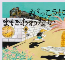
＜作/絵：ザ・キャビンカンパニー＞ ＜出版社：あかね書房＞