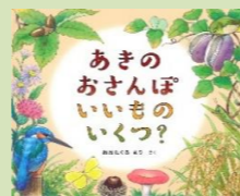
＜作：おたぐりまり＞ ＜出版社：福音館書店＞