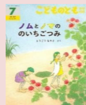
＜作：とうごう なりさ＞ ＜出版社：福音館書店＞