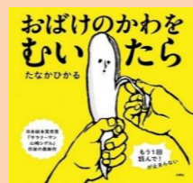
＜作：たなかひかる＞ ＜出版社：文響社＞